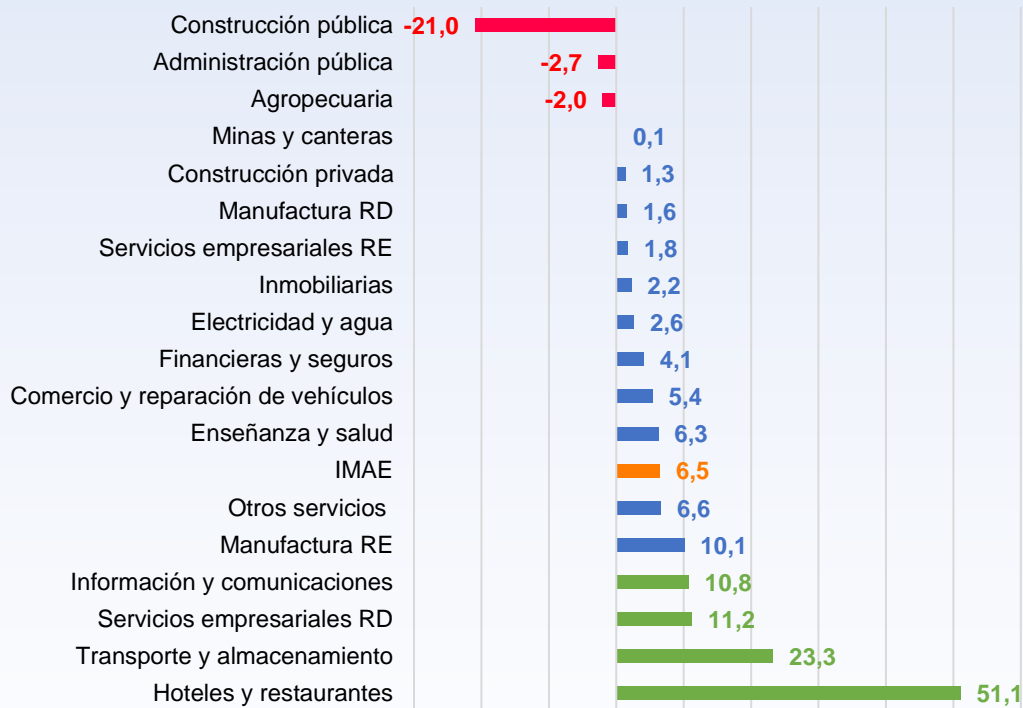
Gráfico 3. Índice mensual de actividad económica Tasa de variación media a junio 2022 (en porcentajes)

En el primer semestre del año 2022 se consolidó el proceso de recuperación en la mayoría de las actividades económicas (Gráfico 3), luego de la contracción observada en los años 2020 y 2021. Así, el IMAE alcanzó un crecimiento medio de 6,5 % para la primera mitad del año.